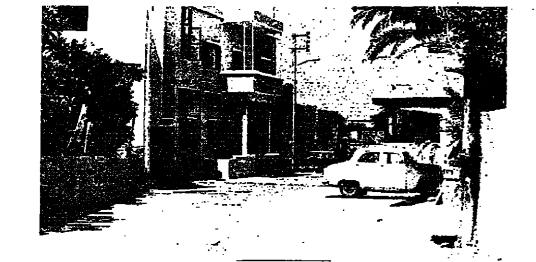
المازل حنينا وتندما محاوران